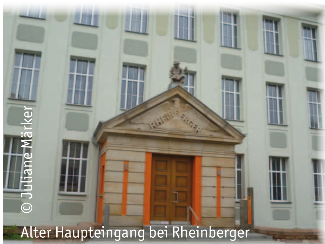
Alter Haupteingang bei Rheinberger