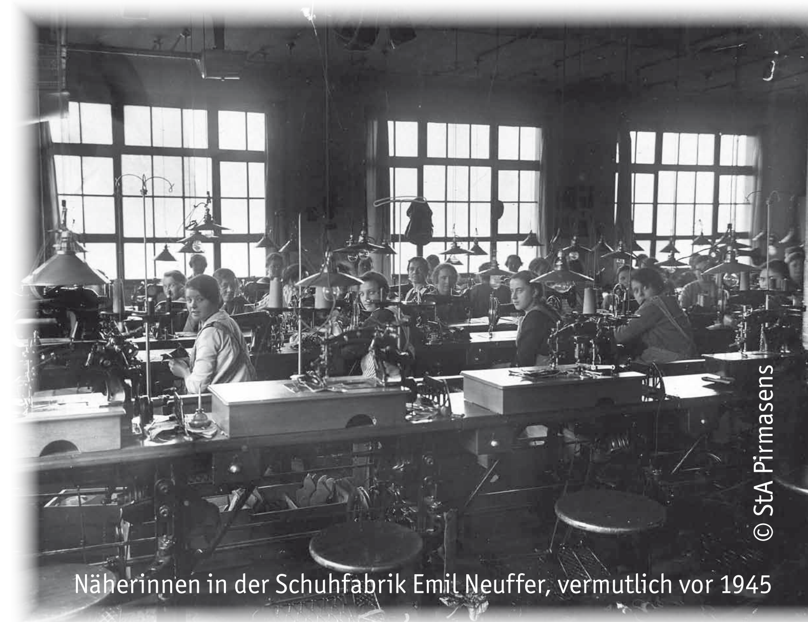
Näherinnen in der Schuhfabrik Emil Neuffer, vermutlich vor 1945