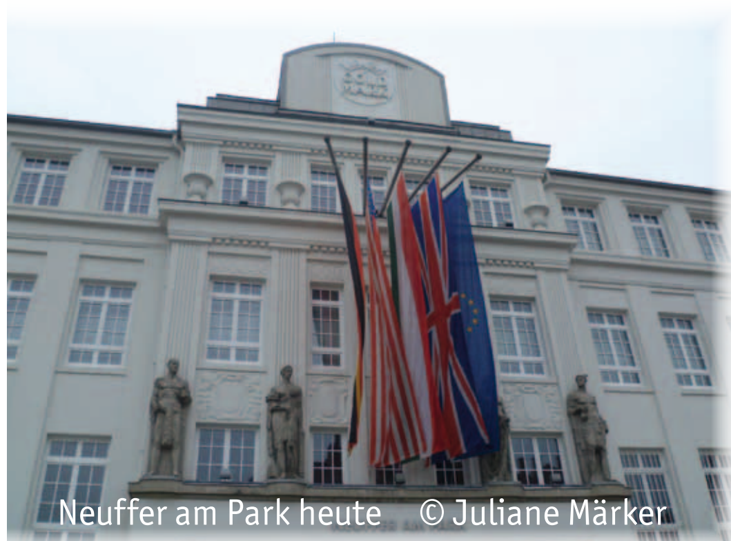
Neuffer am Park heute